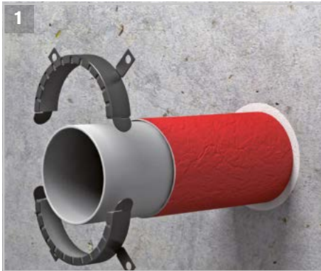
Die Manschette darf um unisolierte und ggf. mit Schallschutzschlauch isolierte Rohre installiert werden.