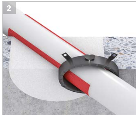
Bei Schrägdurchführungen von Rohren darf die Manschette bis zu 3 Abmessungsstufen größer gewählt werden.