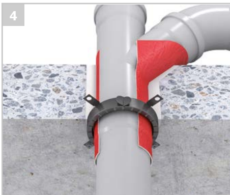
Die AWM III Brandschutzmanschette darf im Bereich der Rohrmuffen sitzen, hierbei wird die Manschette passend zum jeweiligen Muffenaußendurchmesser gewählt.