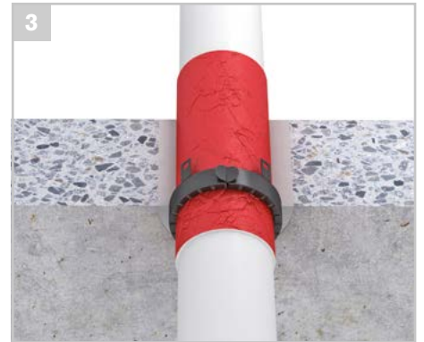
Durch Umbiegen der Befestigungslaschen im nassen Mörtelbett kann die Manschette befestigt werden.